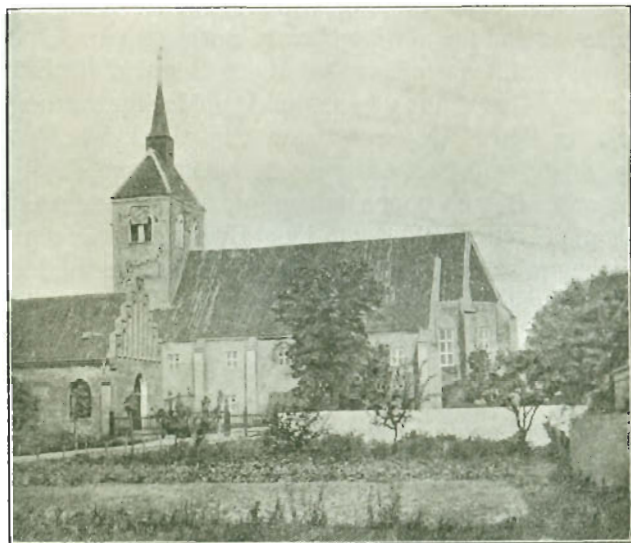
Kirkens Ydre, set fra Syd.

Herrens Hunde, fordi de som Inkquisitionens Udøvere værnede Faarene mod de kætterske Ulve. 1222 stiftedes det første danske Dominikanerkloster i Ærkebispens Stad Lund, og i den følgende Tid fik det mange Eiterfølgere rundt om i de danske Købstæder; der kendes 4 Dominikanerklostre i Lunde Stift, 5 i