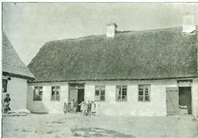
Fig. 1. Forvaltergaarden i Kvarmløse 1914.

Tønde, som var fuld af Sukker, og den havde denne Søkaptajn sendt hjem fra Vestindien, og ingen der i Byen mindes at have set saa meget Sukker samlet paa ét Sted. At Slægten i Tyskland var „grevelig“, er et gammelt Familiesagn. Godsforvalterens Fader skal af en eller anden Grund (Slagsmaal, Duel, dog næppe Drab) være udvandret til Danmark, hvor han i Nord-