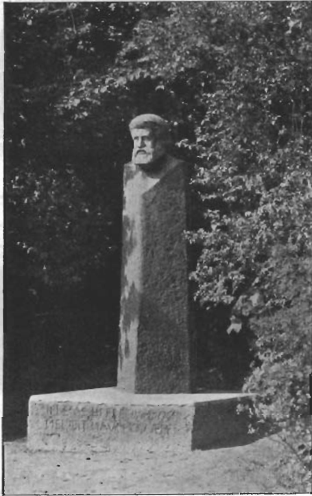
Joachim Skovgaard: Triers mindesten. Vallekilde.