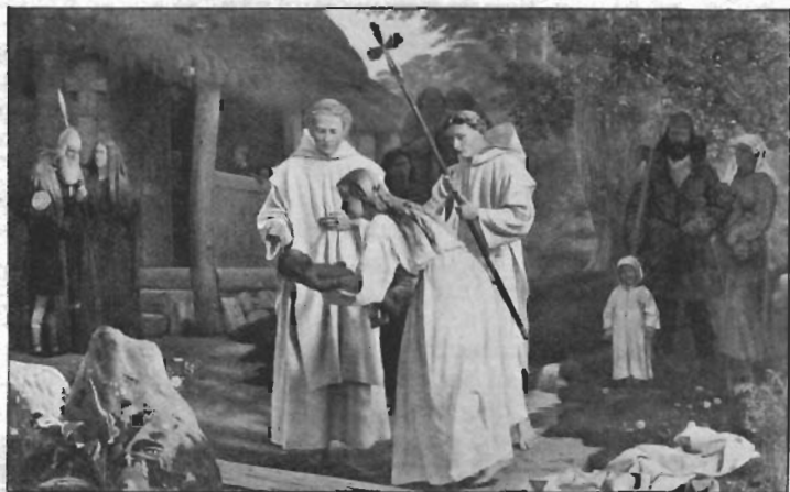
Dalsgaard: Ansgar døber, Vallekilde højskole.

han overgik dem vistnok i følelsens dybde, der gav sig udslag i en mægtig veltalenhed, som selv den, der i tidens løb er kommen til at stå den grundtvigske åndsretning fjærnt, aldrig vil glemme. En feststemning, sjælden vederfaret, fyldte således den ungdom, der i 1884 var med til indvielsen af øvelseshuset. Triers stemme kan endnu efter en menneskealders forløb lyde i ens øre, fordi hans ord kom fra hjertet, og man nynner med på den sang af Hostrup, som i de dage hørtes første gang: »Vi fik ej under tidernes tryk«.