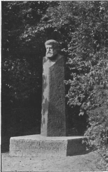
Joachim Skovgaard: Triers mindesten. Vallekilde.

og områdets udvidelse kan læse sig til en organisk udvikling; hus er føjet til hus, hvergang det blev nødvendigt. Endelig fordi kunstneriske krav er blevet respekterede. Den gamle hovedbygning står endnu, men er nu kun et annex til den nye fra 1907, et af Nyrops bedste værker; dekorationen af H. Munk. Af andre bygninger kan nævnes Øvelseshuset, Nyrops første mere bekendte værk, indviet 1884; »Korskirken«, af den ældre Bentsen, fra 1882, dekoreret af Troels Trier; »Hytten« af Nyrop. Af kunstværker i og ved højskolen kan nævnes: Ansgar døber, af Dalsgaard, i foredragssalen, og Grundtvig af Joachim Skovgaard, i spisesluen. Joachim Skovgaard