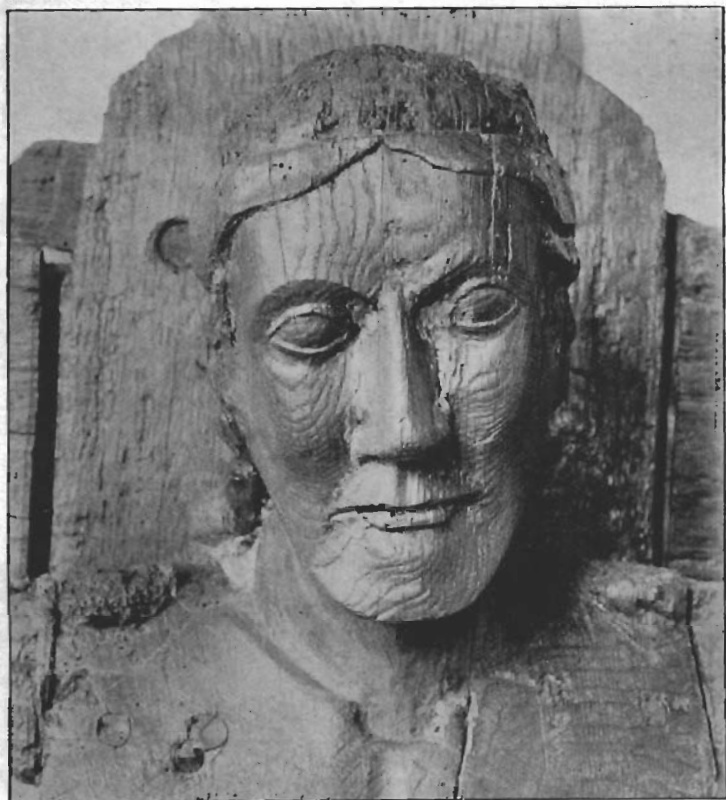
Asnes kirke: Kristi hoved fra krusifixet.