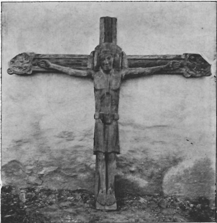
Asnæs kirke: Romansk krusifix.