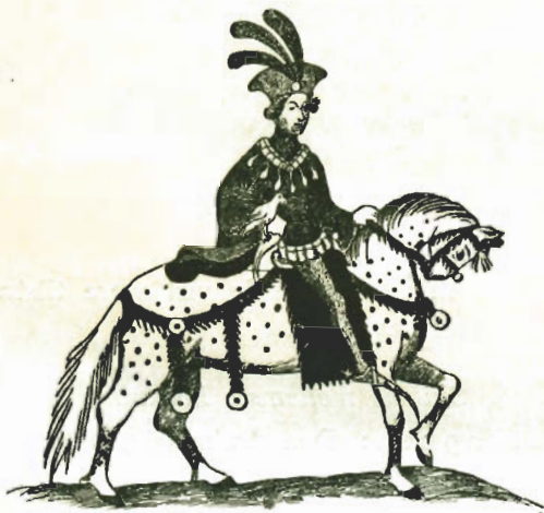
Ridder i Festdragt.

skop i Noyon, en karriere, der paa den tid ikke var slet saa opsigtsvækkende som nu. Den legende, hvorover kalkmaleriet er bygget, fortæller, at da han skulde sko sin hest, skar han først benet af den, skoede det og satte det saa fast igen paa dyret. Det fortælles ogsaa om Løye, som om andre hellige mænd, at han blev fristet af djævelen i en løsagtig kvindes skikkelse. Det maa være den nøgne figur, der ses bag hesten, og som