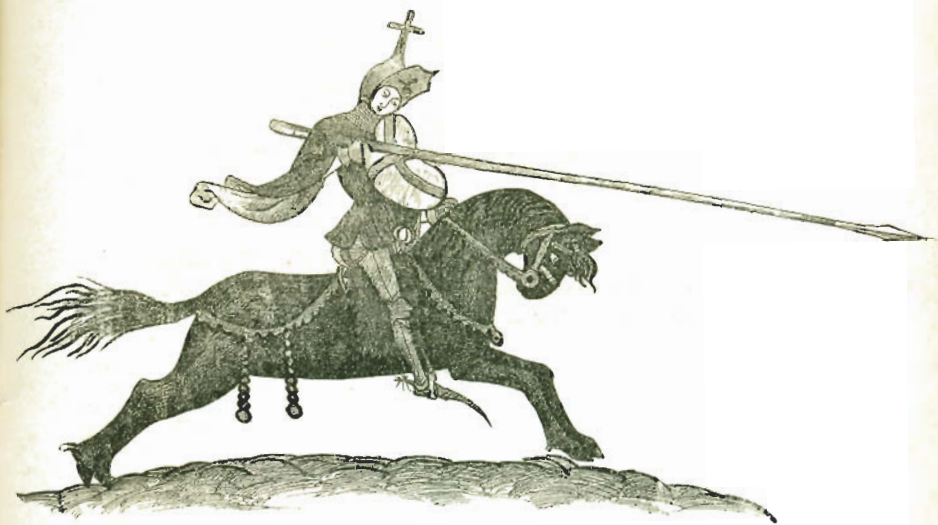
Ridder i Stridsdragt.

mig om, nu maa denne side vist være tilstrækkelig stegt“, skal han have sagt.