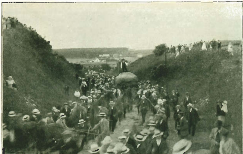
Op gennem Høve Stræde. (Langt ude ses Skoven, hvorfra Stenen kom.)

Præcis 7½ lod Signalet til at gaa i Træk. Trosser og