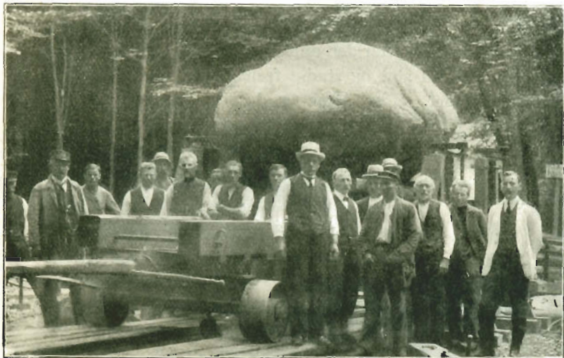
Blokvognen med Stenen.

maa Planker under de næsten 0,5 m brede Blokvognshjul. Skønt det øsregnede om Aftenen, mødte der over 100 Mennesker, der ved direkte Træk fører den 430 m frem i Løbet af godt 3 Timer; havde man ikke — paa Trods af Overformandens Raad — forsøgt sig med at køre uden Plankeunderlag, havde Stenen uden Tvivl