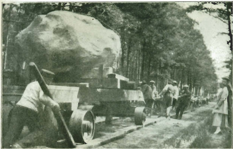
Stenen føres gennem Skoven.

Efterhaanden var det blevet almindelig bekendt over hele Odsherred og mere til, at der foregik en ikke helt almindelig Begivenhed i eller ved Høve.