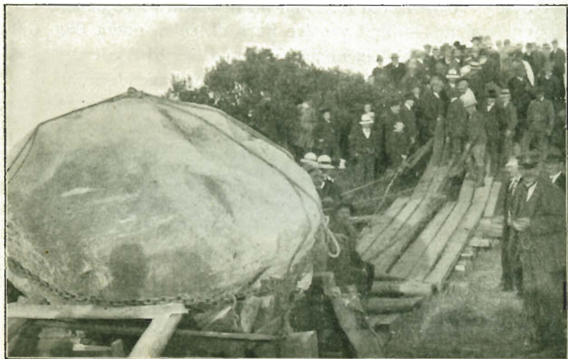
Paa Estherhøj. — Den sidste Stigning er tilbage.

Et Par Gange sprang den svære Jerntrosse, men der skete ingen Skade, og der blev saa anbragt et Par Sikringstræk og Bremsehjælker.