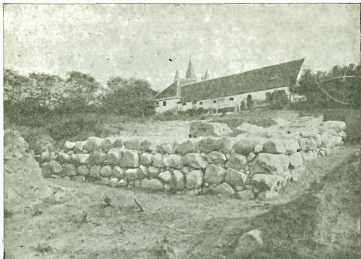
Fra Udgravningerne Nordvest for Byen.

De Fundamenter af det kendte Slot, der skjuler sig tæt under nuværende Torv og dets nærmeste Omgivelser mod Øst, er desværre endnu ikke fremdragne og er indtil videre stumme og tavse som