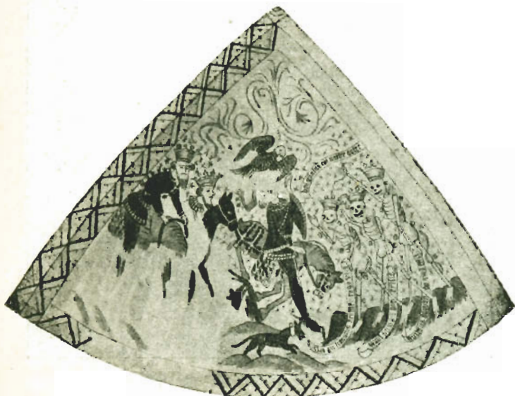
De tre levende og de tre døde.

voksede kornet imidlertid op og modnedes i løbet af natten, og da Herodes' tjenere den følgende morgen kom ridende og spurgte efter de flygtende, gik manden og hans kone og høstede, og det er denne scene, der fremstilles i billedet. Da rytterne fik at vide, at