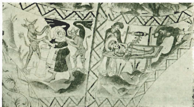
Djævlene og smørkærnersken samt Erasmi martyrium.

mus (biskop i Antiochia, † 303) faar sine tarme vundne ud af kroppen, medens sct. Laurentius steges paa en rist. Bøddernes vellystige glæde over de hellige mænds pinsler er meget realistisk fremstillet.