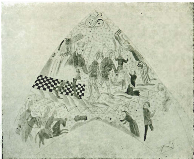
Barnemordet og forfølgelsen af den hellige familie.

Til venstre Herodes med scepter og sværd; til højre hans tjenere, som river børnene op af vuggerne eller ud af de fortvivlede mødres favn for at spidde dem paa deres sværd. Yderst i billedet ser man en moder i raseri slaa løs paa en af bødlerne med opstanderen til sin ten.