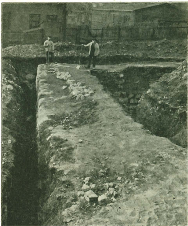
Fig. 3. Det sydøstlige Hjørne af »Folen«, udgravet i Marts 1926. Set mod Syd.

tilbage, saaledes at der her dannedes en Afsats, lige bred nok til at bære en 1 Sten tyk, indre Skalmur af Munkesten, af hvilken ogsaa enkelte Skifter fandtes bevaret paa Østvæggen, og uden Tvivl har denne