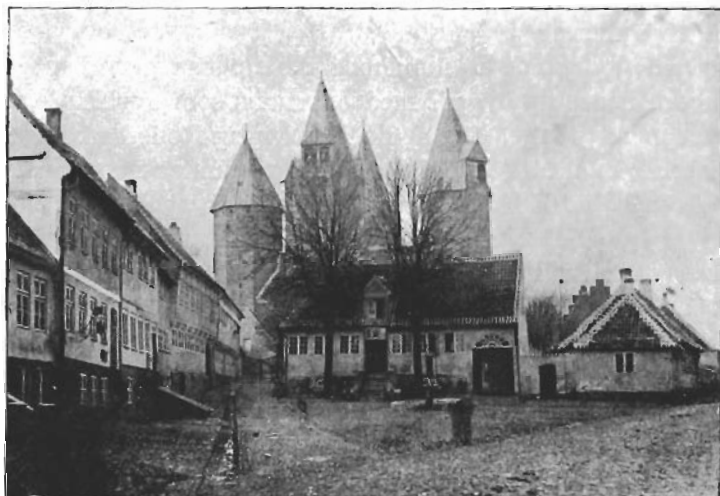
Gammelt Fotografi af Kallundborg Kirke.

Juni 10. K a l l u n d b o r g har ligesom mange andre Byer i Danmark kun lidet at prale af, naar man ser bort