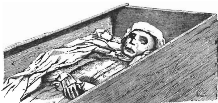
Bothwell (efter Træsnit i Worsaae's Artikel i Ill. Tid. Nr. 123, 1862 „Bothwells Grav i Faarevejle Kirke“).

besidder, der kan rose sig af, at alt bliver gjort godt. Og nu løftes en Faldlem i Koret, en Stige fører ned til Hvælvingen nedenunder, og til højre ligger en simpel Trækiste, der er sat inden i en anden for at være beskyttet. Laaget bliver taget af, et Lagen trukket til Side, og der ligger uden andet Dække det mumieagtige Lig af Skotlands stolteste Jarl. Kisten stod tidligere i en Hvælving i Adelfamiliens Kapel, men blev flyttet af Baronnen til dens nu-