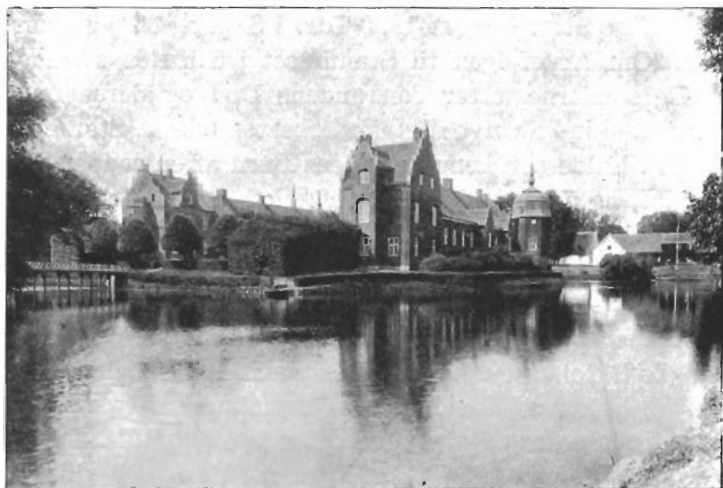
Løvenborg, fra Haven.