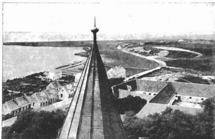
Fig. 1. Lindegaarden med Omgivelser mod Vest, set fra Kirkens Midtertaarn. Bag Gaarden ses Lindevænget. Til v. for Vejen til Røsnæs: Strandvænget. Til h. for Vejen: Lundebakken. I Baggr. til v.: Gisseløre, til h.: Hestehaven.

Nordøst for Lindevænget laa Søtaarnet i det Hjørne, hvor nordre og vestre yngre Bymur stødte sammen. Det har været et svært, firkantet Taarn, hvis nedre Del nu er lagt fri. Det er, ligesom de tilstødende yngre Bynære og Kalundborg Slot, antagelig opført af Valdemar Atterdag, det maa i hvert Fald være ham, der byggede det svært befæstede Slot som Forstærkning af Esbern Snares østre Forborg. Ogsaa Erik Menved har dog forstærket Fæstningens Mure. Rester af Sotaarnet har været at se længe, det blev staaende helt op i det 18. Aarhundrede, og der kan næppe være Tvivl om, at Vængets Navn i 1509 og senere, „Taarnhave“, hidrører fra dette Taarn, der da ogsaa senere maa have gjort sig fremtrædende paa Stedet.