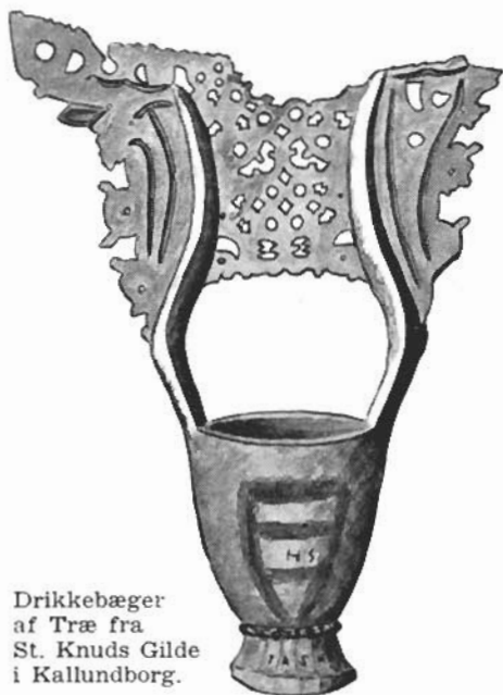
Drikkebæger af Træ fra St. Knuds Gilde i Kallundborg.

sked takket være Olaus Magnus' store værk »Historia de gentibus septentrionalibus« (de nordiske folks historie). Olaus Magnus var broder til Sveriges sidste katholske erkebiskop, Johannes Magnus, der ogsaa var en betydelig historiker. Da reformationen sejrede i Sverige, fulgte Olaus broderen i landflygtighed til Rom, og her udkom hans før nævnte værk i 1555, naturligvis paa latin, da det søgte sin læsekreds blandt de humanistisk lærde i hele Europa. Værket skildrer først de nordiske landes geografi endog ret indgaaende og dernæst indbyggernes liv og fær-