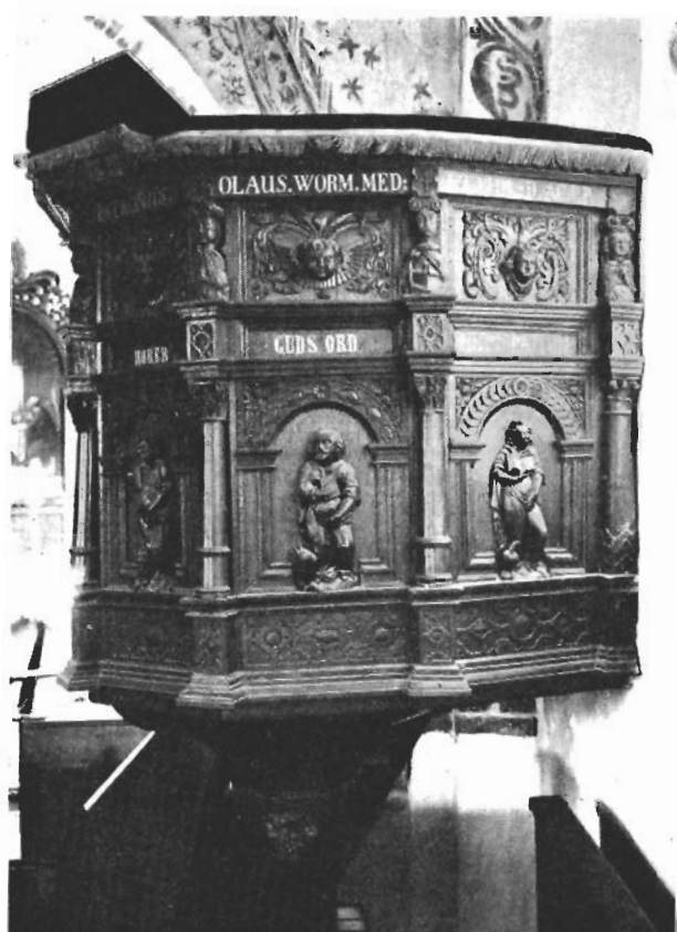
Fig. 2 Prædikestolen i Grevinge Kirke