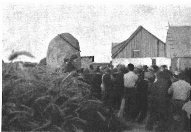
Efter Fyraften strømmer Folk til fra hele Sognet for at trække Blokvoغن med Stenen. Den er her paa Vej forbi Jak. Hansens Gaard, paa hvis Mark den var opgravet

der saa var mange Tilskuere, der hellere end gerne gav et Nap med, og Hurra- raabene lod hver Gang, man kom over en Vanskelighed.