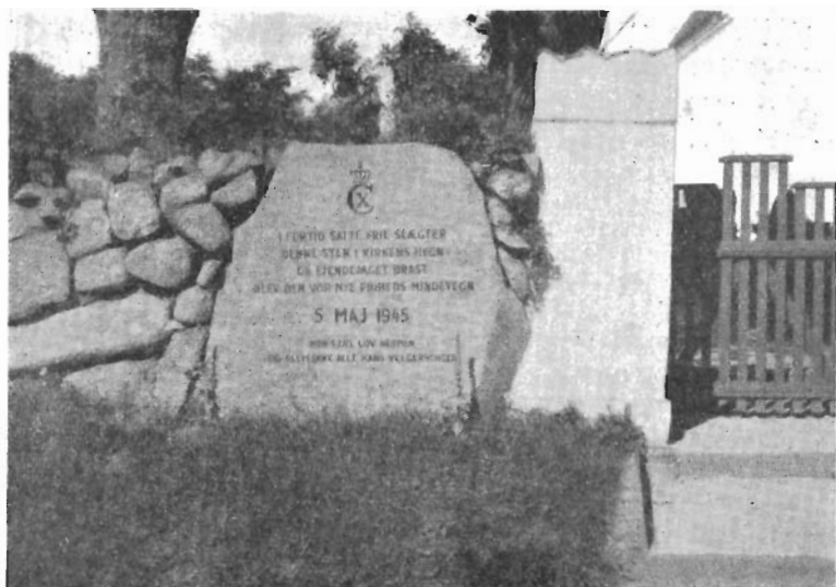
Mindesten ved Nr. Asmindrup Kirke. „I Fortid satte frie Slægter — Denne Sten i Kirkens Hegn. Da Fjendeaaget brast, blev den vor nye Friheds Mindetegn. 5. Maj 1945. Min Sjalov Herren og glem ikke alle hans Velgerninger.

Sten til Minde om denne lykkelige Oplevelse, og det blev endda til hele to Mindestene.